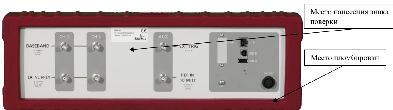
Рисунок 2 - Общий вид задней панели анализаторов